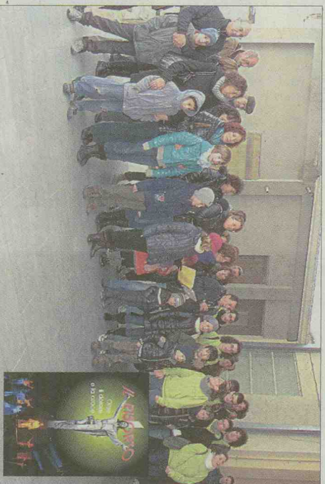
Alcuni membri del gruppo canoro durante l'inaugurazione della Sala Millennium

Il risultato è un coinvolgente viaggio musicale nella memoria dell'evento fondamentale della